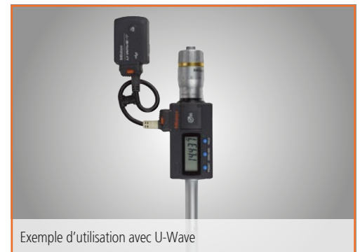
Exemple d'utilisation avec U-Wave