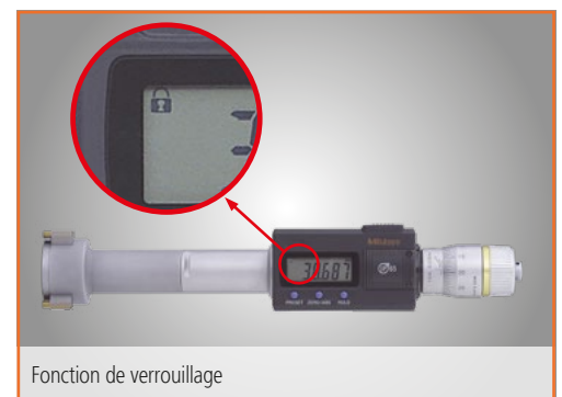
Fonction de verrouillage